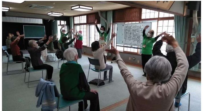
毎週火曜はリーダーさんによるサロンを開催 福祉会館で活動中！