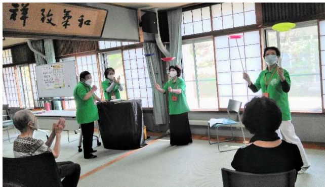
皿回しでひと笑い♪