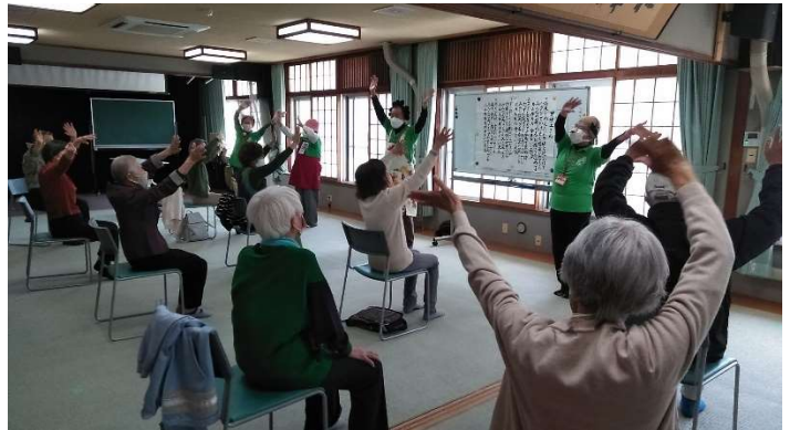
毎週火曜はリーダーさんによるサロンを開催 福祉会館で活動中！