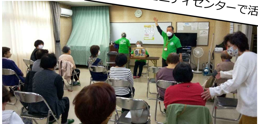
地域のコミュニティセンターで活躍中