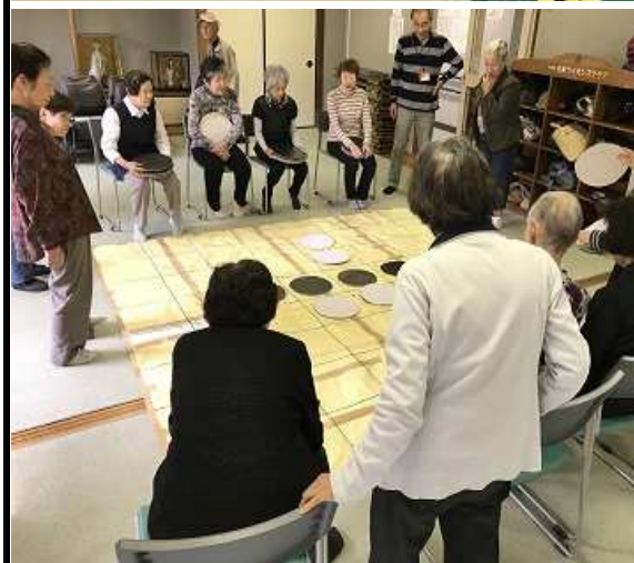
フロアオセロは、意見を合わせるのも大変です(;;)