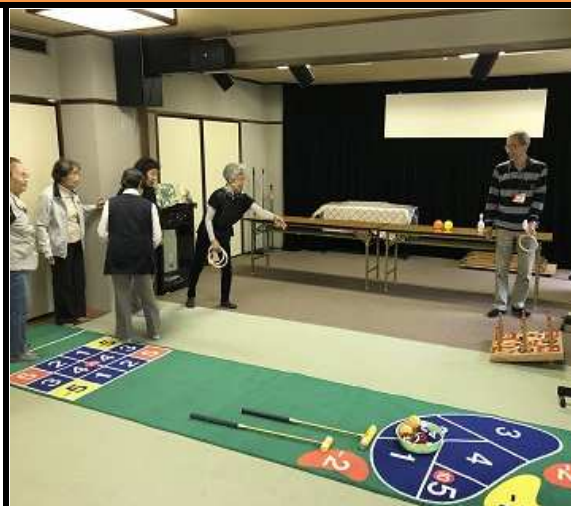
輪投げも意外と難しい...