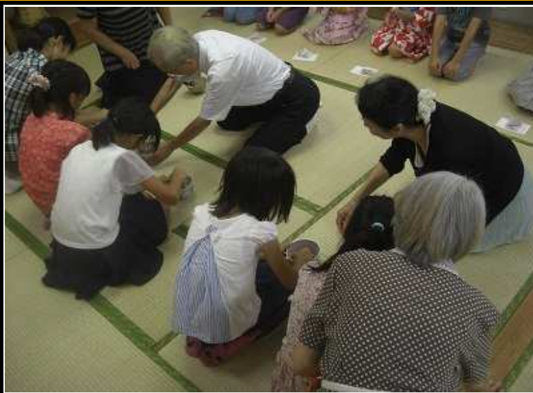
茶道体験の様子 同好会の皆さんに教えてもらいながら 真剣な表情☆

近年は核家族化が進むとともに、むしろそれが普通であるがゆえに「核家族」という言葉すら消えようとしています。世代間で触れ合う機会が減った今、福祉会館と児童館の交流行事に参加して、世代間交流を楽しんでみてはいかがでしょうか☆