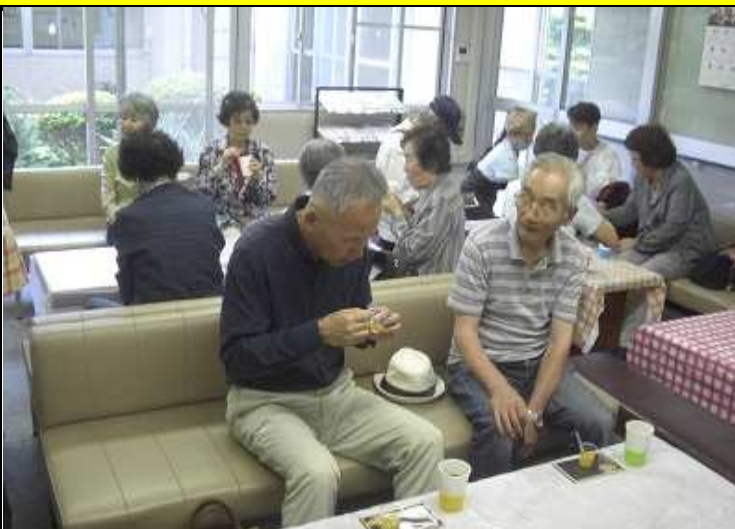
自然に笑顔がこぼれ..... たまにコーヒーもこぼれるのはご愛嬌(^^;)♪