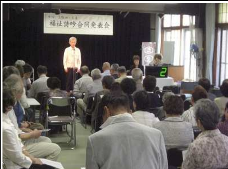
お一人お一人の晴れ舞台です♪

参加された皆様、準備や当日の進行に携わった皆様、本当にありがとうございました。そして上飯田・中川の詩吟講座の皆様、また来年もお待ちしています☆