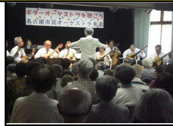
名古屋ギターオーケストラ有志の皆様による演奏

人気の曲には自然に口ずさんだり、静かに聞き入ったりして楽しい時間を過ごした皆さん。後半には「みんなで歌おう」と題して数曲歌うこともでき、お帰りの際は皆さんの笑顔がたくさん見ることができました。これだけの人数で弾かれるギター演奏にはなかなか出会えないことと思います。また是非お越しいただきたいですね☆