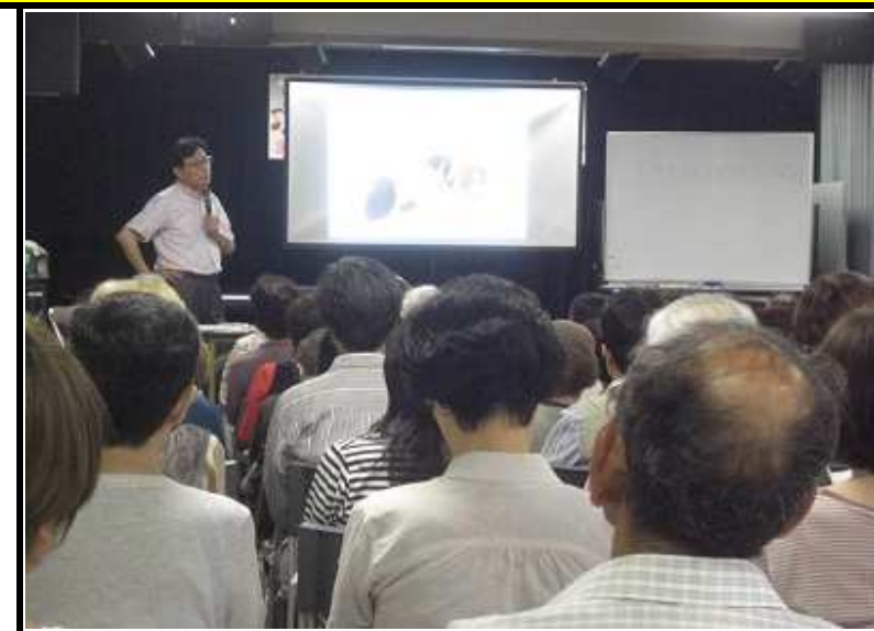
先生のお話に皆さん真剣に耳を傾けます。

「五感を磨いて、肌も心も体も健康になりましょう」先生の言葉に大きく頷いていた皆さん。終了後には「いいお話が聞けてよかった」「参考になったよ」という声を多く頂きました。