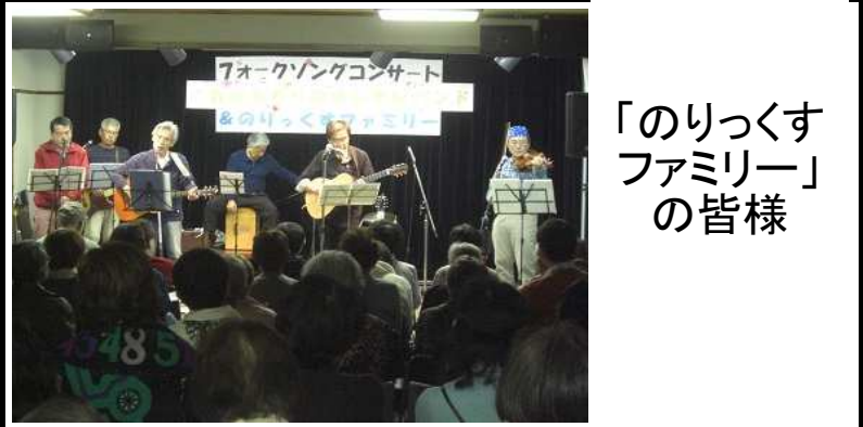
「のりっくすファミリー」の皆様