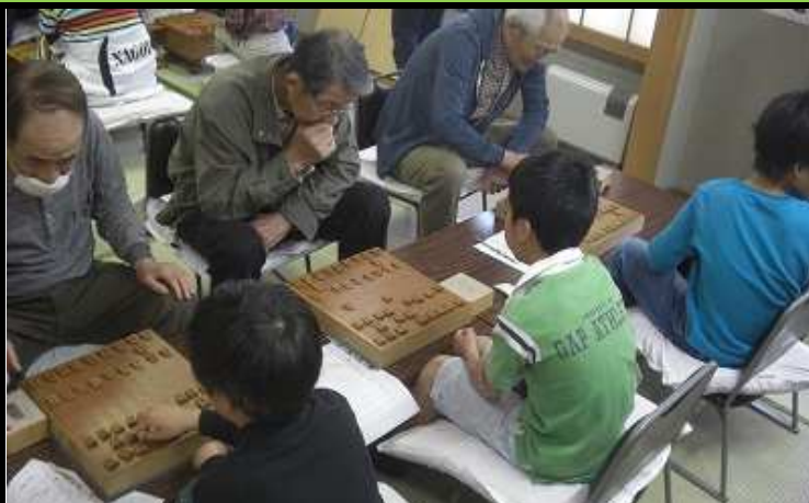
この中から、将来棋士になる子が出てきたりして.....