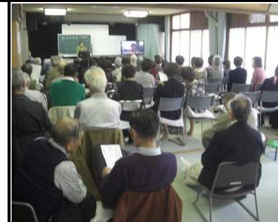
カラオケ 発表会 皆さんの晴 れ舞台です

そして4月1日からは新年度のスタート。平成30年度もまた多くの企画を計画しています。皆様ぜひ積極的にご参加ください。