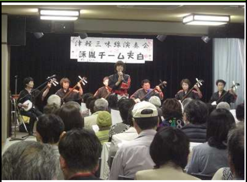
今年も大迫力の演奏を堪能できました

午後からあいにくの雨となった4月17日、「チーム天白味胤」の皆さんによる演奏会が行われました。 恒例となっているこの演奏会ですが、天候が悪かったにも関わらず今回も満員！津軽三味線の演奏、そしてそれに合わせた歌.....会場の皆さんも一体となって場が盛り上がりました。 今回が9回目になる「チーム天白味胤」の皆さん。その演奏にも年々迫力が増してきているように感じます。 楽しい時間は過ぎるのも早く思えるもの。あっという間に1時間半が経過し、次回は10回目のご出演となる皆さんとの再会を約束して、今回の演奏会も盛況のうちに終演となりました。