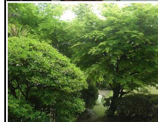
中庭も緑が 増してきました☆