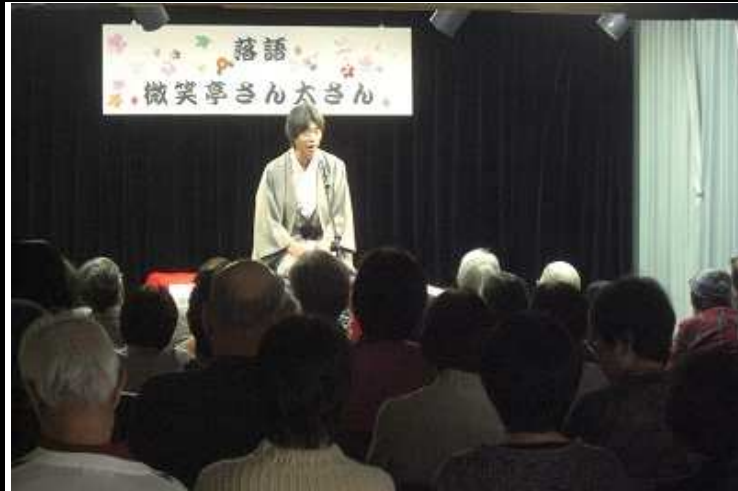
今回も楽しいお話満載でした

今回もまた、身近で新鮮な話題を中心に会場を爆笑の渦に巻き込んださん太さん。そのネタの新鮮さが、ウケる理由なんですよ（「私は寿司か！」なんてツッコまれそうですが）。