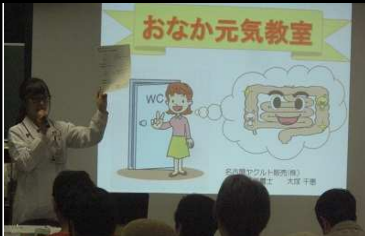
腸も血管も元気で いつまでも健康でいたいですね☆

健康寿命についての関心が高まっている昨今、この日の内容を一つでも覚えて健康に過ごしていきたいですね☆