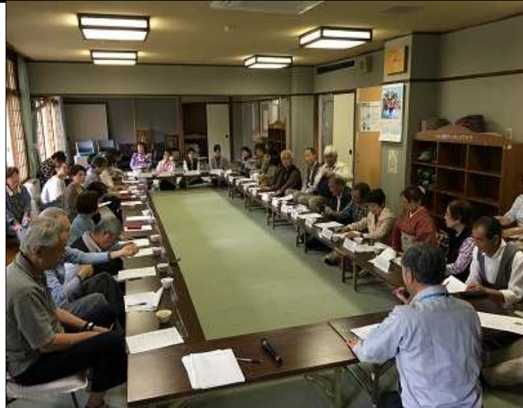
幹事の皆様、一年よろしく申し上げます