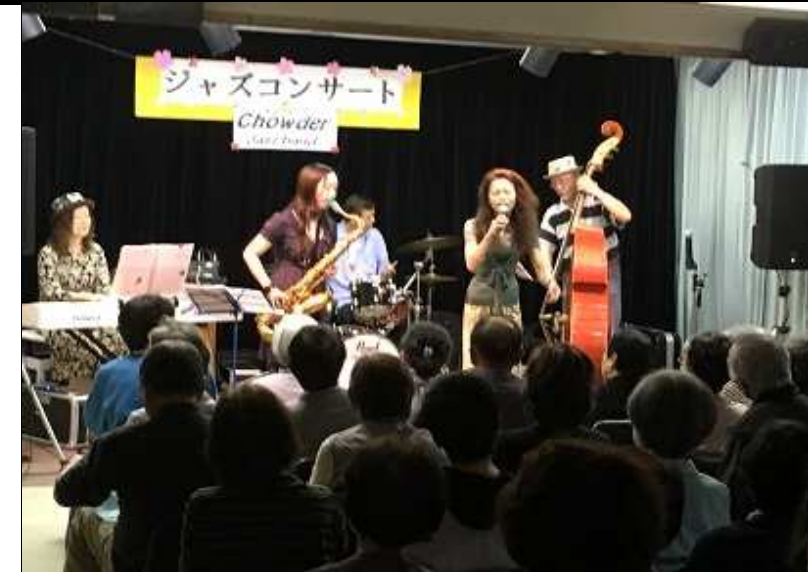
☆「チャウダー」の皆様☆ 演奏に、歌に、トークに 今回も会場を盛り上げて頂きました♪

ゴールデンウィーク真っ盛りの5月6日(土)に、ジャズバンド「チャウダー」さんによるライブが行われました。 もうすっかり恒例となって、根強いファンが増えてきているチャウダーさんのライブとあって、雨が降り出しそうな曇天にもかかわらず、当日は119名という過去最高の入場者数を記録しました。 皆さん馴染みのジャズの名曲からビートルズ、日本の歌謡曲まで、素敵な演奏と歌を聴かせて頂いた上に、トークでも大盛り上がり！ 最後の曲「テキーラ」に合わせて会場の方もダンスで盛り上がりいただき、今回もまた期待通りのライブとなりました。 チャウダーさんには、また12月に「クリスマスライブ」としてお越しいただける予定です。乞うご期待！