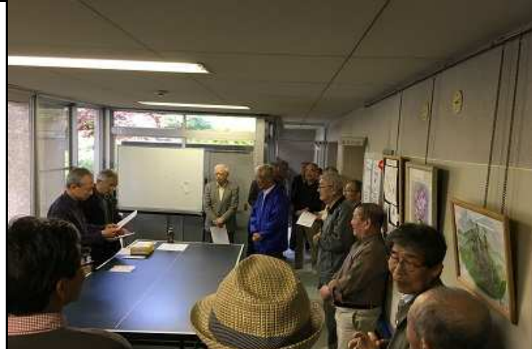
表彰式の様子。 入賞された方、おめでとうございます☆