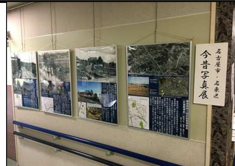
「この頃にこの辺の土地少し買っておきや今頃大金持ちだったのになあ」なんて嘆きの声も...

5月8日から14日まで開催された名東区民まつりの協賛企画として、区役所のご協力を得て今年も「名東区今昔写真展」を開催しています(区民まつり終了後も、5月いっぱいまで開催予定です)。 区内各所の昔と今を比較した写真の数々は、名東区に長く住まれている方には「そうそう、昔はこんな風景だった!」「この向こうにある広場でよく遊んだ!」といった回想法の世界に、そして近年移り住んだ方には「えっ? あんな大通りが昔はこんな畦道だったの?」といった驚きの世界に、それぞれ案内してくれます。 廊下を歩いていると、思い出話や写真の感想まで、様々な会話が交わされている場面によく出会います。